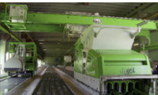
Ekstruder E9 w zakładzie prefabrykacji płyt kanałowych firmy Voss.

Hjellestad spogląda w przyszłość z dużym optymizmem. „Aktualnie produkujemy tygodniowo 1700 m 2 płyt kanałowych i około 150 t innych prefabrykatów. Sercem