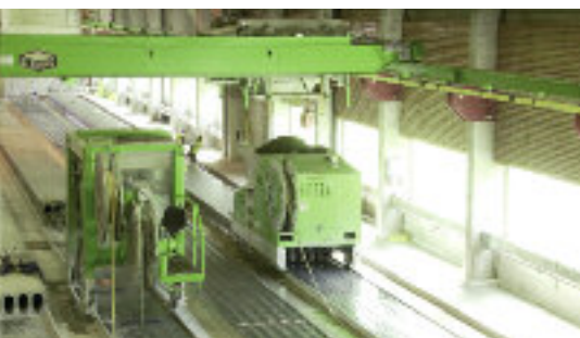
Ekstruder podczas pracy.