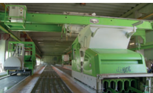
E9 Extruder im Betonwerk von Voss

2011 führte Voss eine Marktuntersuchung zum Potenzial von Spannbetonfertigdecken durch und stellte fest, dass derlei Produkte