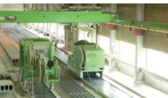
Extruder in Aktion

zurzeit sehr gefragt sind. Es gab nur einen konkurrierenden Fertigteilhersteller in Bergen, also waren die Aussichten auf dem Markt im Westen Norwegens sehr gut. Nach gründlicher Untersuchung der Lieferanten von Produktionsanlagen für Spannbetonfertigdecken entschied das Unternehmen, in das moderne Produktionssystem für Spannbetonfertigdecken von Elematic zu investieren.