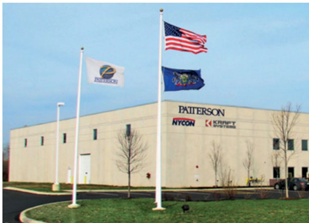
Североамериканская производственная площадка компании Kraft Curing Systems' у компании A.L. Patterson, Inc. Фейерлесс-Хиллс, Пенсильвания

Компания A.L. Patterson, Inc., являющаяся вот уже в течение 40 лет главным поставщиком сборной железобетонной продукции на рынок Северной Америки, имеет более 20 лет опыта в области продаж и обслуживания клиентов, выбравших оборудование Kraft для тепловлажностной обработки бетона.