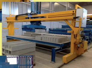
Производство Погрузка Складирование