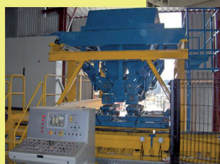
Декоративная плитка по технологии литья