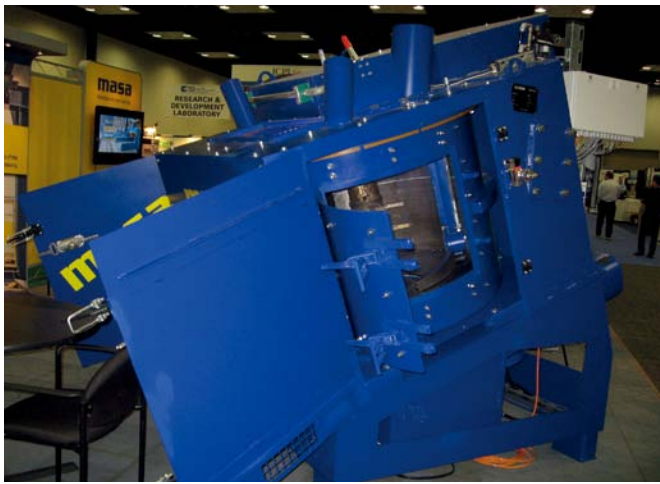
Masa Twister 搅拌机（约 500 升的干燥填充量或约 350 升的输出产量）可用于生产染色饰面混凝土

在 2013 年 1 月初的 Indianapolis 预制混凝土展会上，高科技 Masa Twister 混凝土搅拌机的展示引起了参观者的极大兴趣。这使得人们有更多的机会对如何实现最佳的搅拌效果进行信息交流和探讨。Masa 公司的专家们与展位前的参观者讨论着 Masa 四年来一直潜心生产的 Twister 设备的创新部分和优势所在。此款搅拌机（约 500 升的干燥填充量或约 350 升的输出产量）可用于生产染色饰面混凝土。