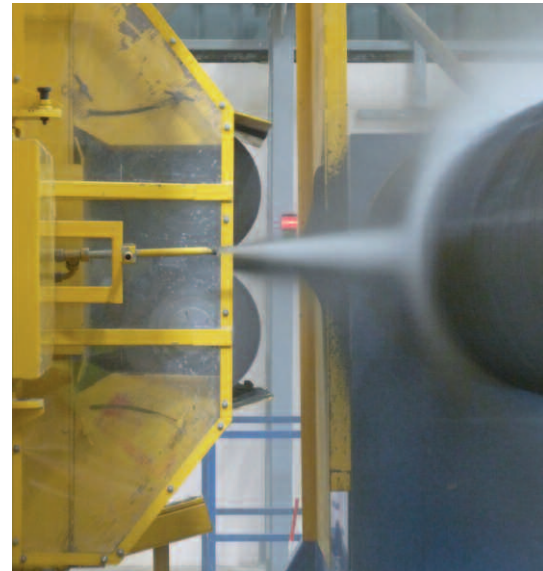
На завершающем этапе производства на трубу наносится специальный защитный слой из центрифугированного бетона

зочных операций для обеспечения автоматического выполнения всех задач с минимальными затратами на переоснащение оборудования.