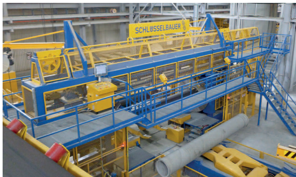
Установка для навивки арматуры компании Schlüsselbauer укладывает арматуру со скоростью до 6 метров в секунду