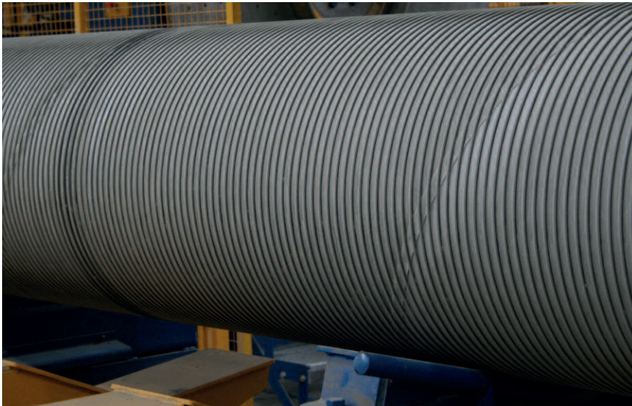
В зависимости от необходимого рабочего давления для каждой отдельно взятой железобетонной напорной трубы определяется диаметр, предварительное напряжение и шаг укладки арматурной проволоки