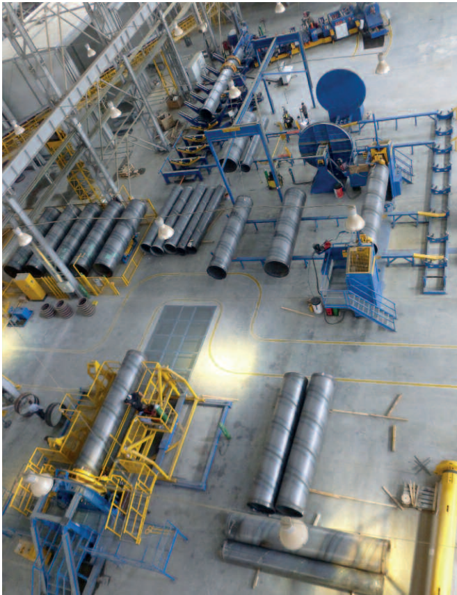
Для установки сердечника, используемого для обеспечения герметичности трубы, автоматически сваривается цилиндр, затем он наращивается до необходимой длины и тестируется