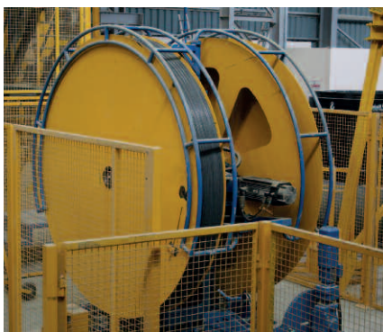
Катушки стальной проволоки устанавливаются на установку. Проволока подается со скоростью 6 метров в секунду

C303. Универсально должно было быть спроектировано и оборудование для постановки стального сердечника, стальных опорных колец и арматурного каркаса. С той же степенью универсальности и гибкости должна была быть организована система погрузочно-разгру-