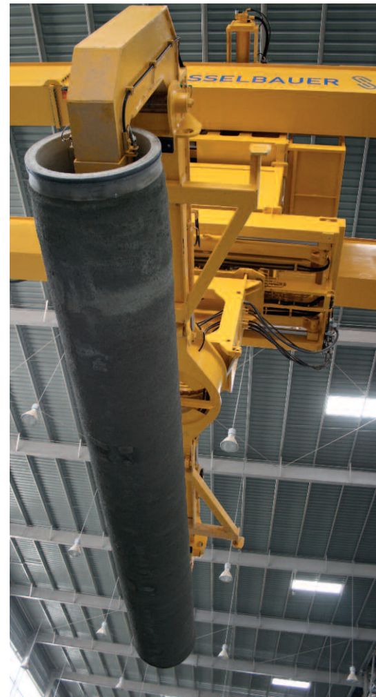
Автоматический кран Transexact перемещает готовую продукцию в камеру ТВО, а затем на конвейерную ленту для перемещения на внешний склад

Компания Amiantit Oman была основана в 1974 году и на сегодняшний день считается крупнейшим производителем в стране. Порядка 900 сотрудников работают на компанию Amiantit Oman, а 80 из них являются сотрудниками Amiantit Oman Concrete Products LLC. Компания была создана из совместного предприятия крупнейших групп компаний в султанате Оман, а именно: Omzest Group, Suhail Bahwan Group и Saud Bahwan Group. 2/3 оборота группы компаний Omzest Group, состоящей из 75 предприятий, полностью или частично принадлежащих ей, приходится на производственные предприятия. Группа компаний Suhail Bahwan Group включает более 40 компаний, а группа компаний Saud Bahwan Group предлагает на рынке продукцию многих мировых производителей автомобильной отрасли, таких как Ford, Toyota или MAN.