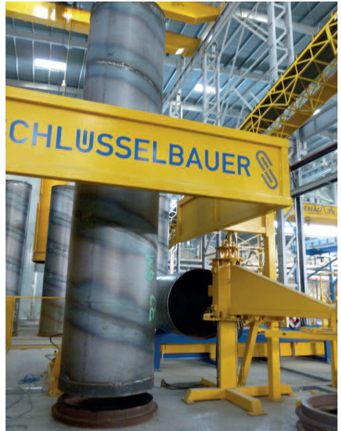
Для облицовки изнутри стальной цилиндр устанавливается на муфту и заливается жестким бетоном

технологии производства. Множество методов, например, технология производства с использованием одного, двух и трех слоев, технологии кольцевого и/или продольного предварительного напряжения, соединение труб, заставили компанию собрать команду консультантов. После прояснения требований, предъявляемых к строительству трубопроводов в султанате Оман, и сравнения с доступными технологиями производства, выбор был сделан в пользу труб, изготавливаемых путем укладки двух слоев бетона, стальным сердечни-