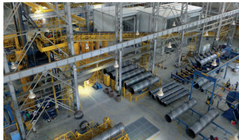
Высокая степень автоматизации всей производственной линии обеспечивают безопасность обслуживающего персонала и продукции, а также оптимизирует продолжительность рабочих операций