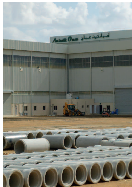
Наряду с бетонными безнапорными трубами компания производит железобетонные напорные трубы диаметров от DN300 до DN1800

Для разработки данной концепции производства железобетонных напорных труб были проанализированы все