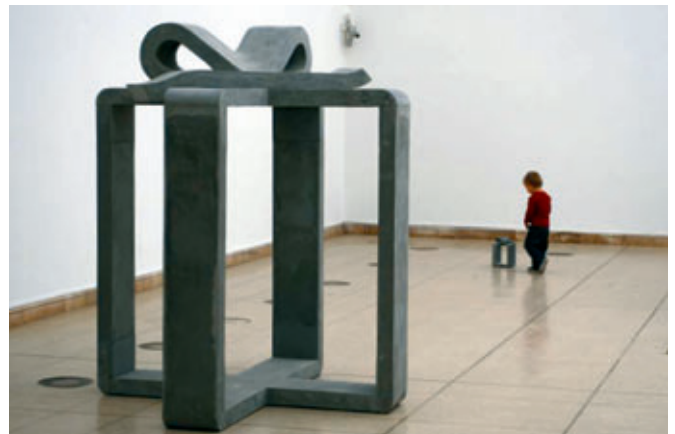
Arte in calcestruzzo – made by Dolomit