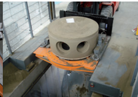
Prelievo del fondo fresato del pozzetto dall'impianto Primuss