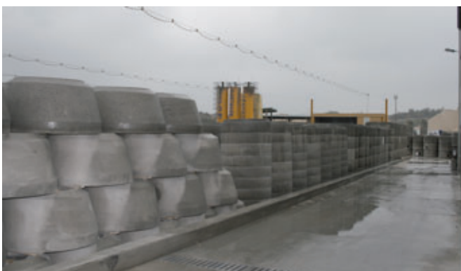
Dolomit offre ora il programma completo di pozzetti in calcestruzzo