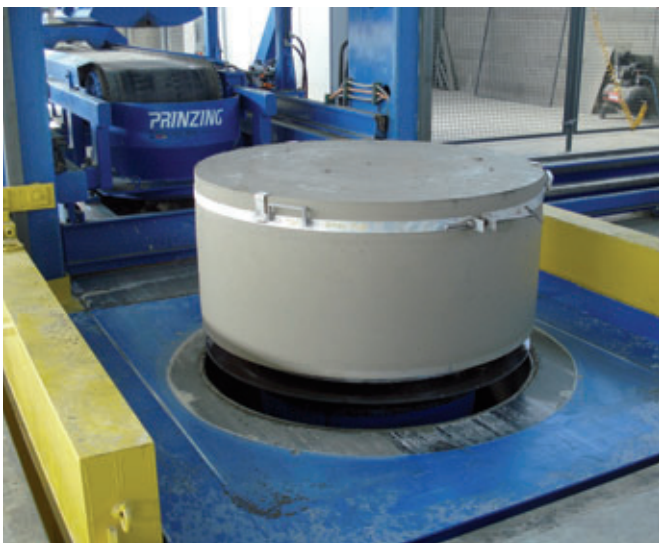
Pezzo grezzo del fondo del pozzetto disarmato. Il pezzo grezzo può essere trasportato nella stazione di fresatura dopo un breve tempo di maturazione.