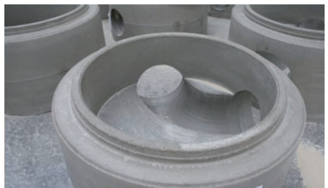
I fondi di pozzetto in calcestruzzo fresati con il procedimento Primuss godono subito di una forte domanda