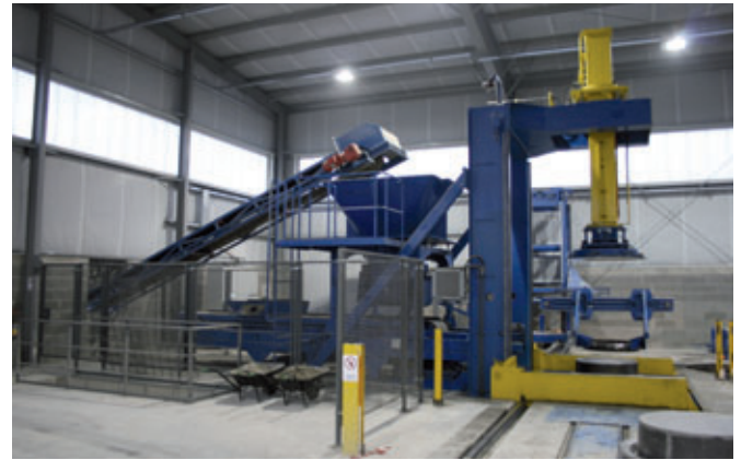
Macchina per pozzetti Tornado di Prinzing, completamente automatica