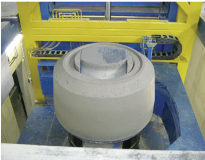
Cono per pozzetto durante il processo di disarmo nell'impianto Tornado. Tornado consente a Dolomit di realizzare l'intero programma per pozzetti: coni, anelli e fondi