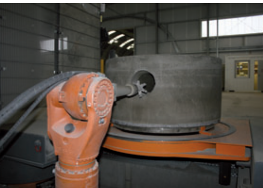
Una volta completata la fresatura di un raccordo, il braccio del robot arretra e il pozzetto è ruotato automaticamente nella posizione di fresatura successiva.

Prinzing GmbH Anlagentechnik und Formenbau Zum Weißen Jura 3 · 89143 Blaubeuren, Germania T +49 7344 1720 · F +49 7344 17280 info@prinzing-gmbh.de · www.prinzing-gmbh.de www.top-werk.com