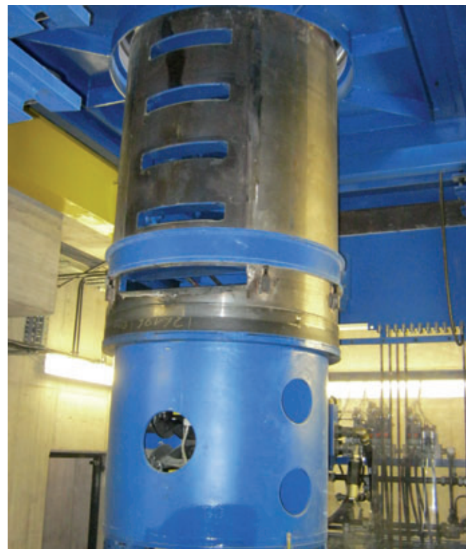
Anima dello stampo degli anelli per pozzetti per la vibrazione diretta di gradini