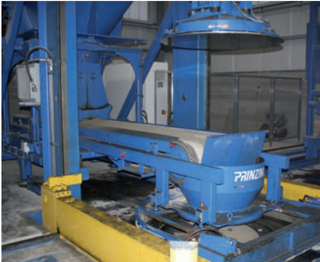
Gli sportelli di dosaggio sotto il serbatoio di accumulo del calcestruzzo assicurano il riempimento ottimizzato dello stampo