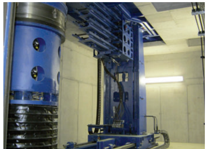
Magazzino gradini automatico per la produzione di anelli e coni per pozzetti