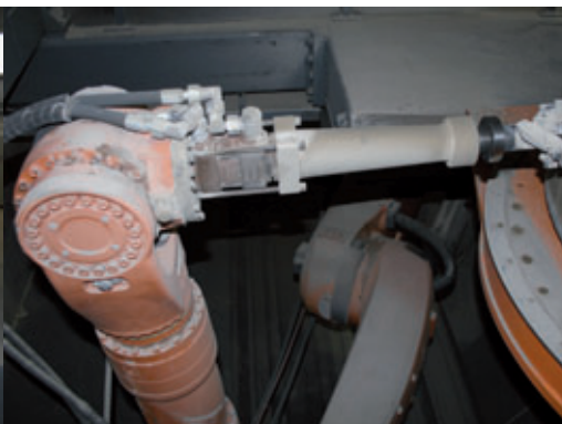
La risulta di fresatura cade direttamente nella fossa di lavoro e il nastro di trasporto presente sul pavimento assicura la rimozione continua.