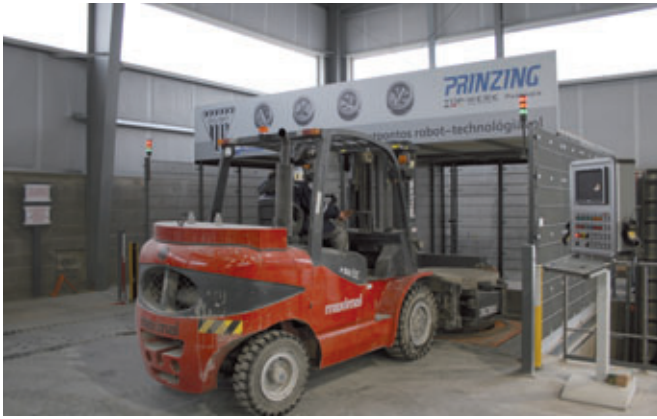
Stazione di fresatura Primuss con due postazioni di lavoro