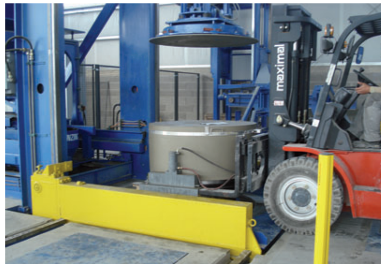
Prelievo del pezzo grezzo del fondo dall'impianto Tornado

Presso Dolomit Kft. si è installata una stazione di fresatura con due postazioni di lavoro a livello del pavimento. Il robot installato nel piano cantina ha la propria area lavoro dietro (per i raccordi) e sotto (per le canaline) il monolite per il pozzetto in calcestruzzo. La stazione è racchiusa, un sistema a nastro di trasporto nella cantina garantisce la rimozione della risulta di fresatura dall'area di lavoro dell'impianto Primuss. A seconda della composizione della miscela, i pezzi grezzi in calcestruzzo avranno raggiunto una resistenza sufficiente già dopo 60 minuti. Successivamente, i pezzi grezzi sono sollevati dal cappello di supporto e convogliati alla stazione di fre-