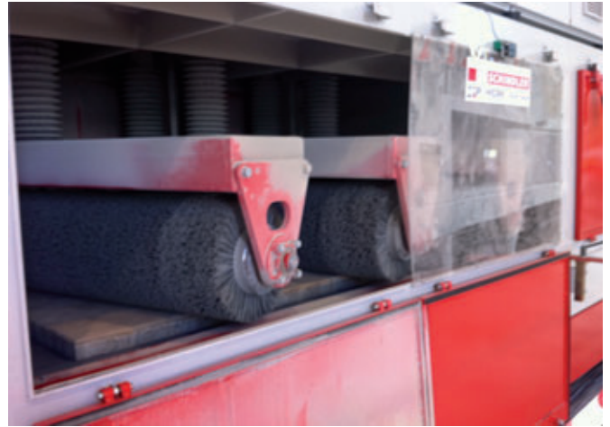
Vue sur les brosses à curler

Le revêtement de surface est ainsi un nouveau développement qui fut présenté. Les produits sont tout d'abord préchauffés avec un chauffage à infrarouge, ils sont ensuite pulvérisés d'une couche de protection de surface puis séchés par rayonnement infrarouge. La protection de surface TopCoat a été développée par un chimiste polonais et est commercialisée par la société Chemtech Bayern. Lors de la foire maison, les chimistes de Chemtech étaient à la disposition des visiteurs avec des informations spécialisées et la société Riedel, experte de Rheinböllen en produits de ponçage et fournisseur des segments de ponçage des machines SR-Schindler, présentait en outre différents outils de ponçage pour diverses applications.