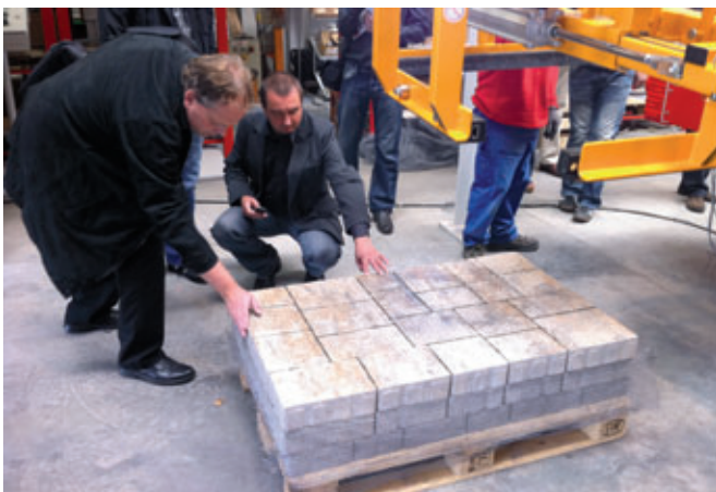
Les pavés finis « incitent » au toucher

L'installation de démonstration va par ailleurs être installée dans les mois à venir - avec une seconde chaîne de finition - dans une fabrique de béton en Pologne. CPI-Worldwide sera bien sûr sur place pour vous en donner tous les détails.