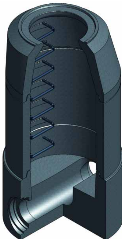
Кольцо с конусом

Одновременно с этим осуществляется переналадка установки Tornado на производство труб, конусов или крышек колодезных люков. Продолжительность переналадки, благодаря использованию гидравлического механизма закрепления форм и сохранности в памяти процессора программы, сокращена до минимума. При производстве отдельных элементов на установке Tornado используется технология вибропрессования.