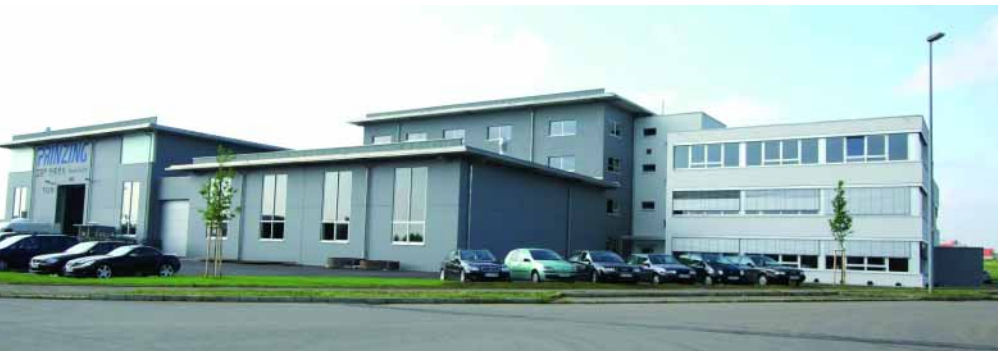
Офис компании Prinzing GmbH в Блаубойрен, Германия

Новой целью и новой задачей для компании Prinzing стало совершенствование и развитие производственных процессов и оборудования с целью обеспечения экологических требований. Значительный шаг в этом направлении удалось сделать благодаря усовершенствованию установок Tornado/Primuss, теперь стало возможным рациональное и экономичное производство монолитных колец с днищем, труб, конусов и крышек колодезных люков на одной установке. Первая из подобных усовершенствованных установок нового типа была продана в Венгрию.