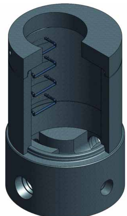
Кольцо с крышкой