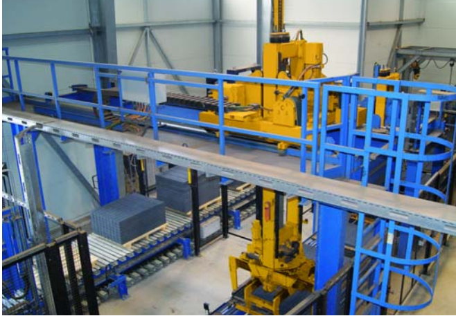
Пакетировщики с сервоприводом