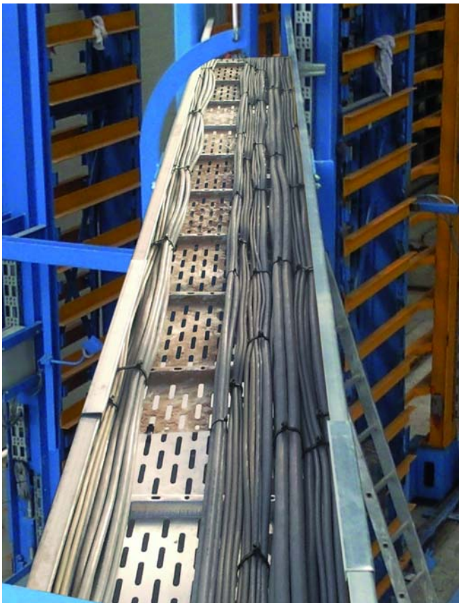
Проводка кабеля через кабельный лоток

После выдержки камни доставляются из камеры ТВО на «сухую» сторону производства, где камни автоматически укладываются в пакеты. Надежная конструкция пакетирующей установки выполнена из конструкционной стали. Поворотно-хо-