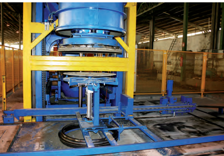
Установка Tornado автоматом встраивания грузоподъемных анкеров