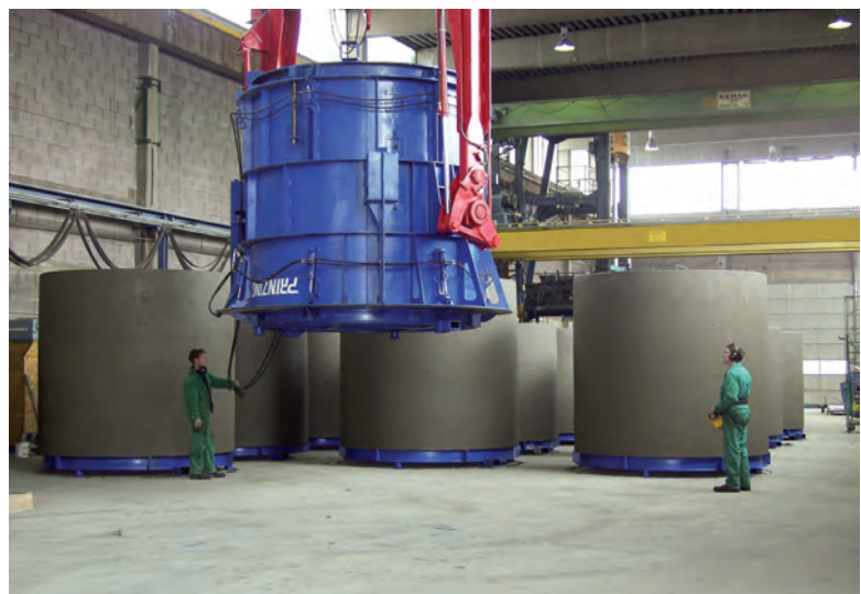
Производство колодцев с крышками

что уже спустя короткий период разработки первая установка была приобретена фирмой Ruf из Вильсбургштеттена. Экономичность нового решения уже привела к росту спроса на него. Сегодня в производстве Prinzing находятся две установки Primuss, и были подписаны контракты на еще три установки.