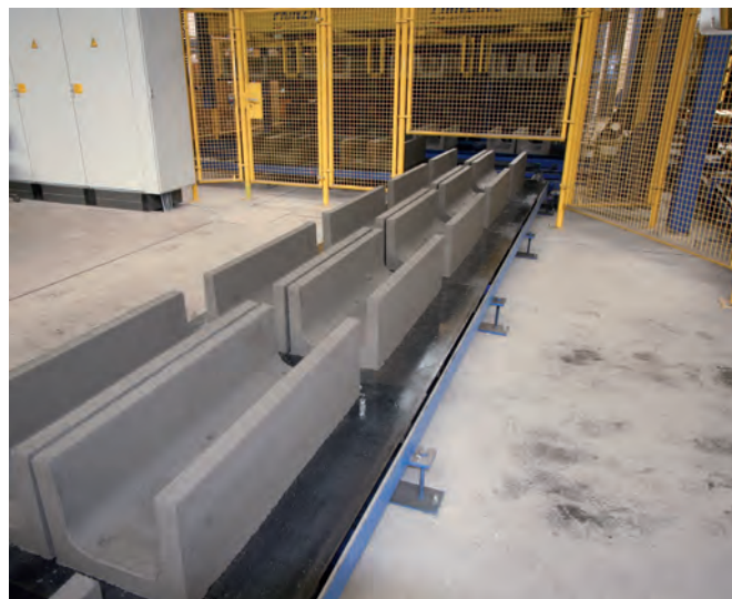
U-образные каналы на установке Blizzard