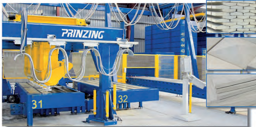
Установка Zelus для сухого формования и литьевым способом

Blizzard – это формующий автомат с кантователем для производства различных бетонных изделий (ливневых лотков, кабельных каналов, крышек колодцев, опорных колец, т.п.). Внедрение новой технологии вибрации (вибрации с регу-