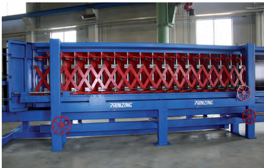
Быстрорегулируемая опалубка для лестниц Sirius