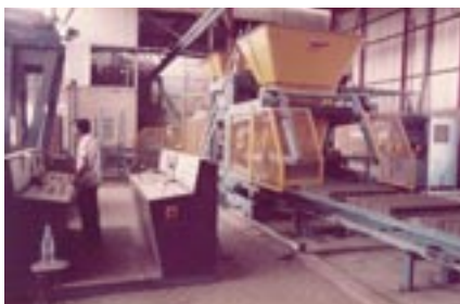
Record 9000 VB, Pasco, 1982.

Dzisiaj Pasco jest jednym z wiodących producentów wyrobów betonowych w regionie Bliskiego Wschodu. Wykorzystuje własne źródła surowców, tj. posiada zakład płukania kruszyw, dzięki któremu poprawia ich jakość w celu zwiększenia wytrzymałości i wyrazistości kolorów produkowanych wyrobów betonowych. Każdego roku projektowane są nowe rodzaje kostki brukowej. Firma Pasco oferuje szeroki wybór kostki brukowej oraz szereg nowych produktów takich jak gazony, elementy murków oporowych, bloczki wielofunkcyjne, bloczki z płukaną powierzchnią, itp.