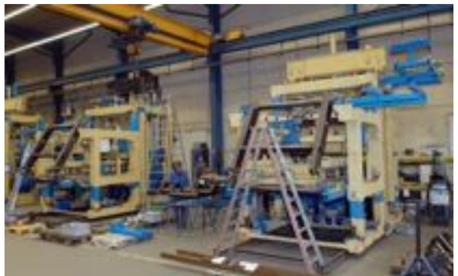
Linie nr 8 i 9 w firmie Pasco podczas produkcji.

Ruchomy zasobnik na ogniwach obciążnikowych zbiera wybrane kruszywa z poszczególnych silosów i transportuje je do wind betoniarek. Naważanie odbywa się