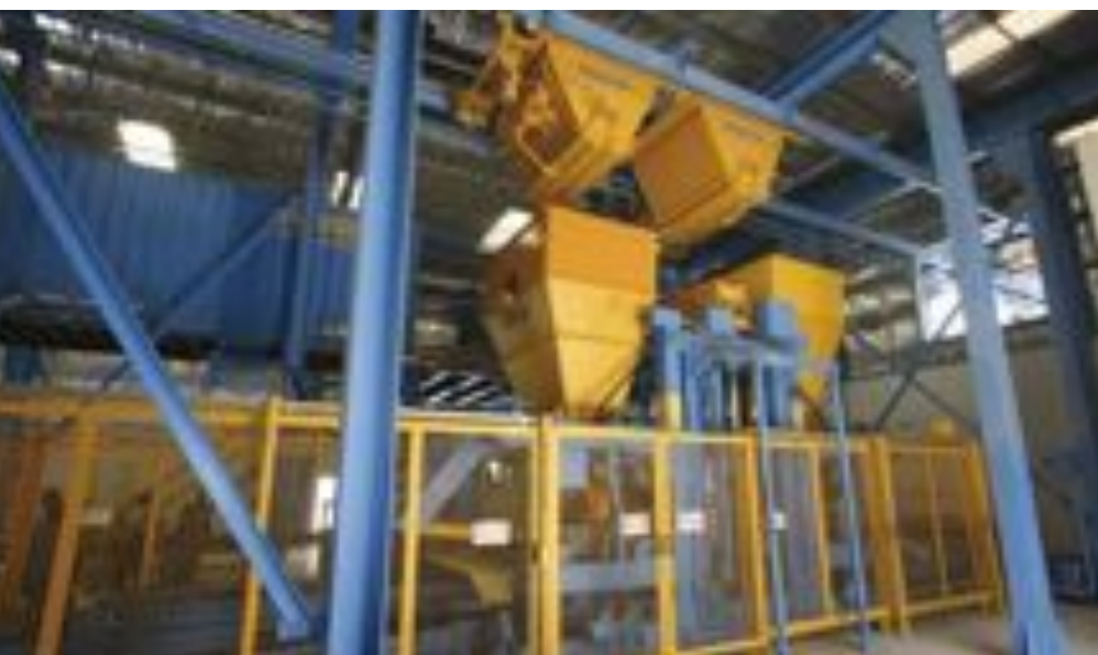
Wibroprasa XL 9.2 wraz z wózkiem szynowym.

200 linii technologicznych firmy Masa do produkcji betonowych bloczków i kostki brukowej na Bliskim Wschodzie jest potwierdzeniem tego, jak ogromne znaczenie mają dobre stosunki z klientami, wysoka jakość oferowanych produktów i doskonały serwis posprzedażny. Idąc w ślady firmy Pasco, która kupiła 9 linii technologicznych firmy Masa, szereg innych firm z Bliskiego Wschodu również zdecydowało się rozwijać razem z Masa i kupować kolejne maszyny u tego samego producenta.