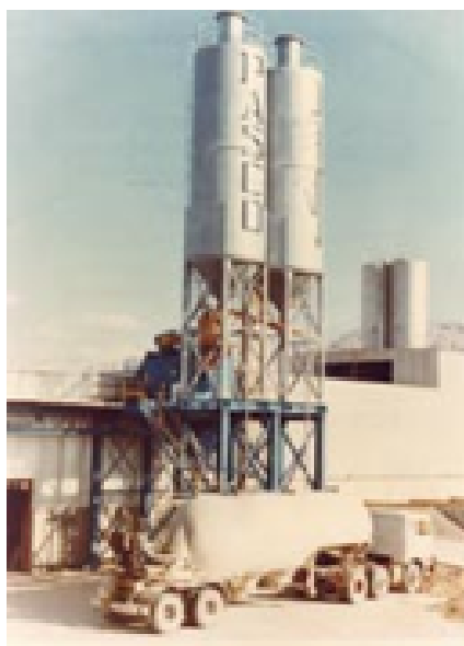
Pierwsza linia technologiczna Pasco wraz z węzłem betoniarskim.