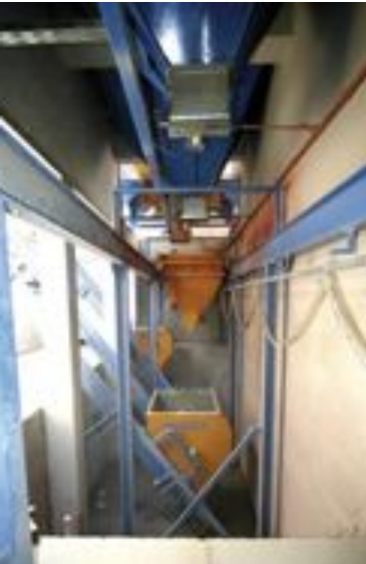
Ruchomy zasobnik wagowy z windą betoniarki.

niezależnie od cyklu mieszania, dzięki czemu może przebiegać szybciej.