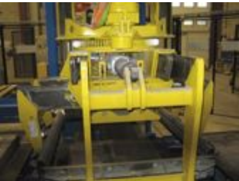
Robot pakietujący z chwytakiem napędzanym silnikiem serwo.