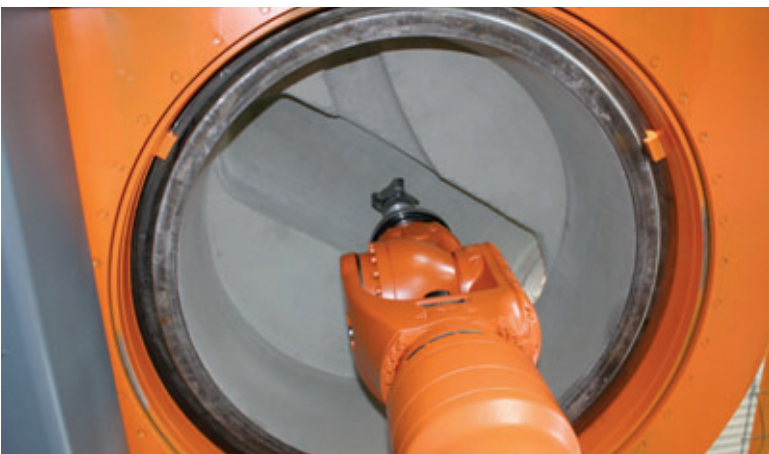
Das Gerinne wird von unten herausgefräst

Aus dem Maschinenbau ist bekannt, dass Teile am genauesten hergestellt werden können, wenn alle Bearbeitungsschritte in einer Aufspannung erfolgen. Diesem Prinzip folgend werden die Monolithen noch auf dem Stahlendring ruhend in teilerhärtetem Zustand auf der Frässtation abgesetzt und genau zentriert.