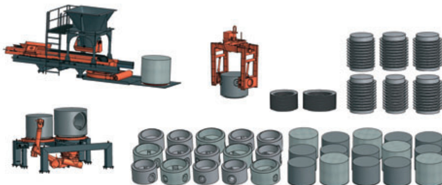
Bei der Entwicklung der Primuss-Anlage hat Prinzing den Weg verfolgt, die Produktion zu vereinfachen und zu automatisieren