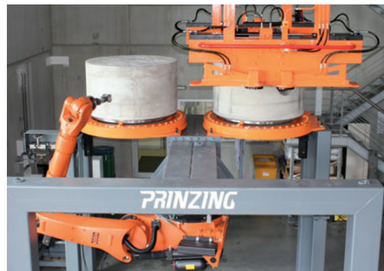
Die Monolithen werden noch auf dem Stahlendring ruhend in teilerhärtetem Zustand auf der Frässtation abgesetzt und genau zentriert