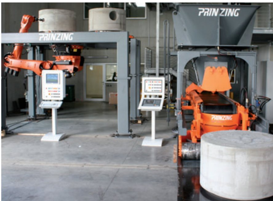
Produktion von monolithischen Schachtunterteilen mit der Primuss

In der Verkaufsabteilung werden die Angebote für die Schachtunterteile erstellt und die Kunden über die monolithische Bauweise der Primuss-Schächte informiert, sowie über die Vorteile der strömungstechnisch optimalen Ausführung der Gerinneverläufe. Dadurch werden Stauungen und Verwirblungen vermieden. Darüber hinaus werden die Gerinne auch vor schädlichen Ablagerungen geschützt. Die Schachtunterteile bestehen vollkommen aus Beton. Alle gängigen Rohrarten können angeschlossen werden. Die dazugehörigen Dichtungen sind fest in den Muffen inte-