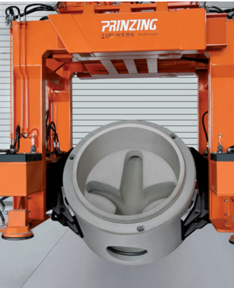
Das Wenden der Schachtunterteile in die natürliche Lage erfolgt deshalb direkt nach dem Fräsvorgang

griert. Bei der Bestellung wird der Auftrag mit Hilfe eines Warenwirtschaftssystems erfasst und alle Schachtparameter eingegeben. Der Rechner führt automatisch eine Plausibilitätsprüfung durch. Der Kunde erhält anschließend per Fax die Schachtdaten zur Prüfung und Bestätigung. Anhand der Bestelldaten und Lieferzeiten wird die Produktion eingeplant und durchgeführt.