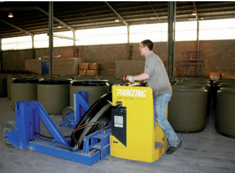
Электрическая транспортировочная тележка