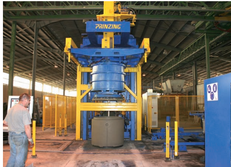
Установка Tornado 150/150