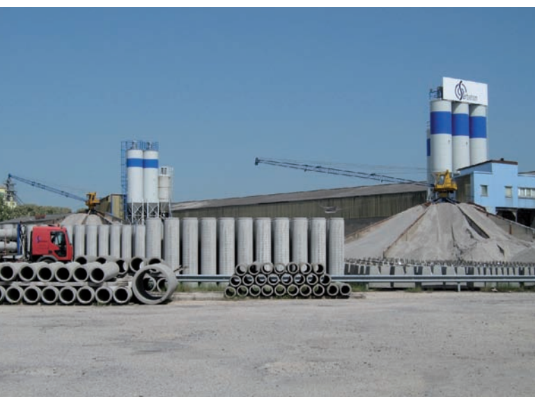
Фирма Sarbeton в Кескастеле, Франция