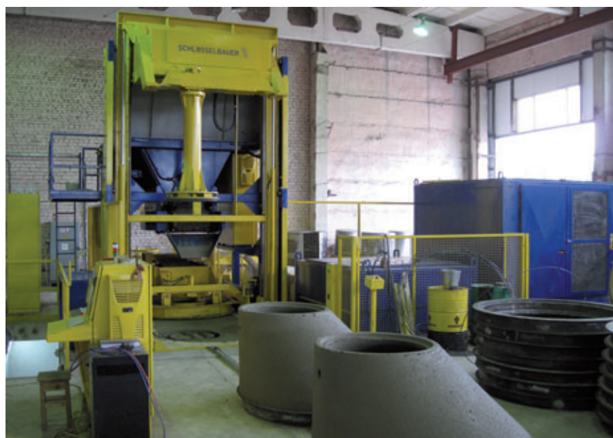
Production de têtes réductrices chez OOO <<SMK-50>> avec la nouvelle installation de production Magic de Schlüsselbauer