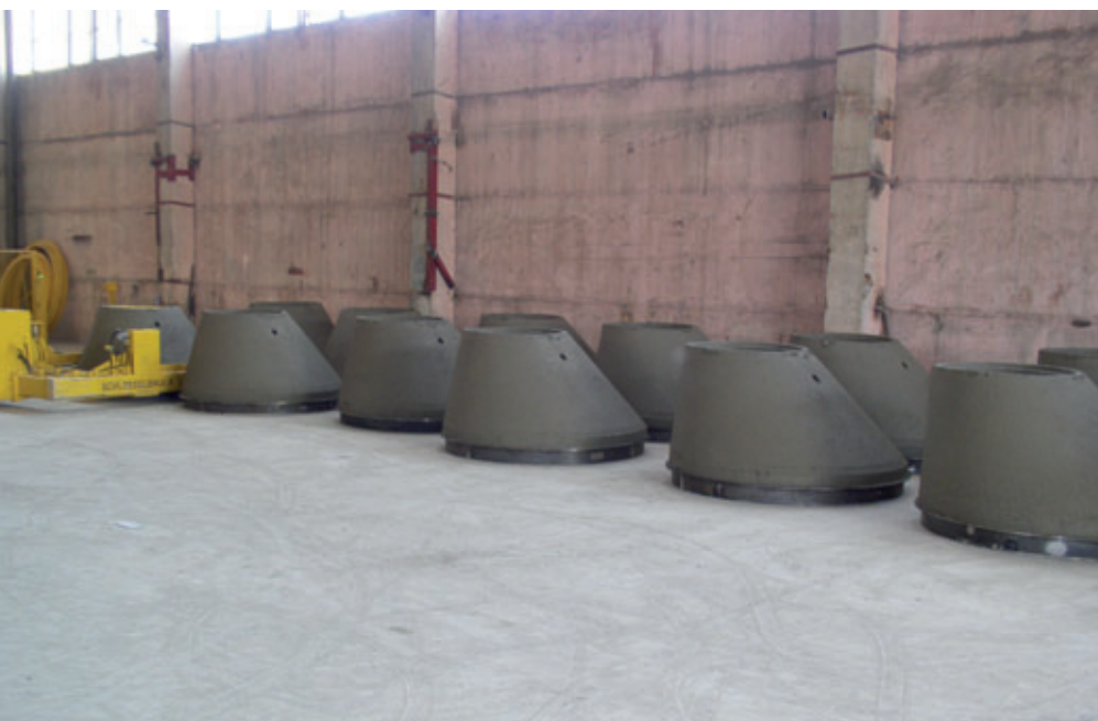
Têtes réductrices sur le parc de séchage dans l'atelier de fabrication