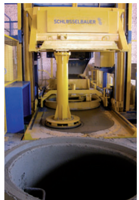
Déroulement d'un cycle de production: introduction de l'embase, remplissage du moule, démoulage après compression puis sortie de machine