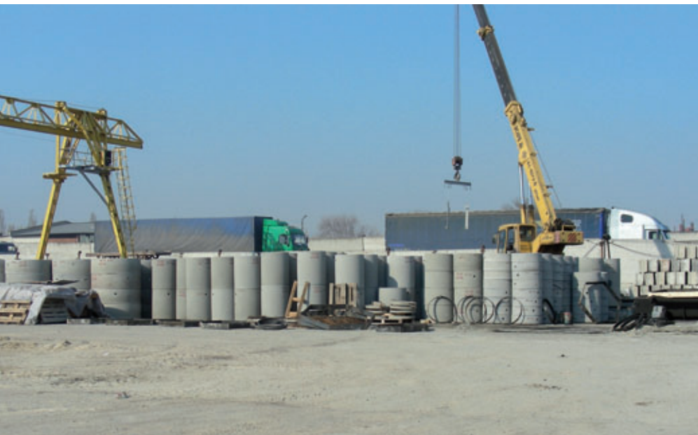
Éléments droits dans la zone de chargement de OOO <<SMK-50>>

Après le débagage les embases sont envoyées automatiquement au nettoyage. Ensuite elles sont lubrifiées selon la procédure précédemment expliquée et remises à disposition pour le prochain cycle de production.