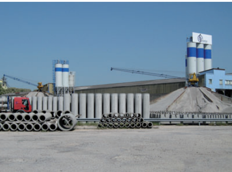
Firma Sarbeton in Keskastel, Frankreich