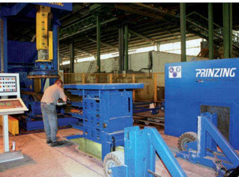
Bestücken des Steigbügelmagazins

ten. Weiterhin sollte durch Einsatz von Handlungssystemen die körperliche Arbeit erleichtert werden und die Tagesproduktion ansteigen. ▶