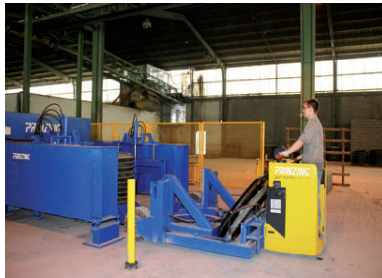
Zuführen der Untermuffen

Die Firma Sarbeton hatte genaue Vorstellungen, wie eine Produktionsanlage für die vorhandene Produktpalette auszusehen hat. Zur Produktion von Schachtringen und Schachtkonen sollte eine flexible, platzspa-