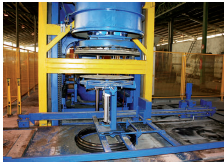
Automatisches Einlegen der Transportanker