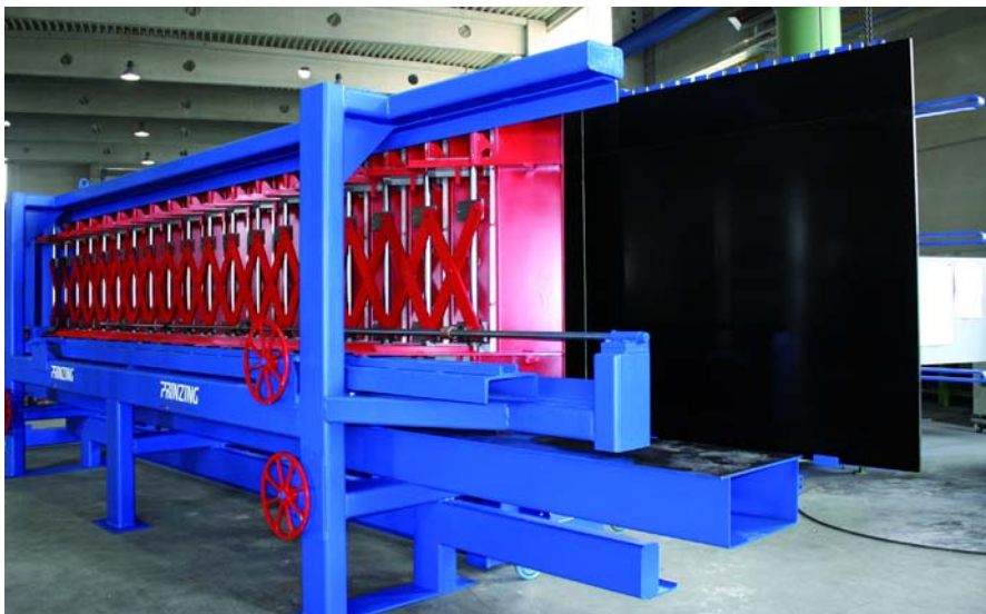
Система регулируемой опалубки для производства прямых лестничных маршей из сборного железобетона

Prinzing GmbH Anlagentechnik und Formenbau Bruckfelsstraße 9 · 89143 Blaubeuren, Germany T +49 7344 1720 · F +49 7344 17280 info@prinzing-gmbh.de · www.prinzing-gmbh.de www.top-werk.com