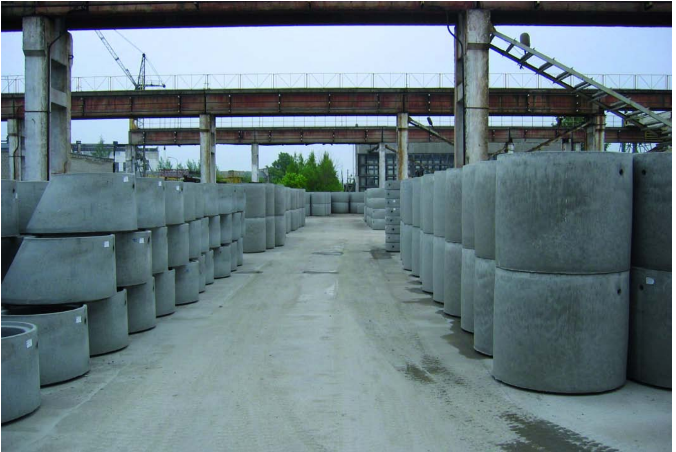
Соответствующие духу времени шахтные элементы для использования в сооружении подземных сетей в Литве – на фотографии конусы и кольца, произведенные на фирме Kauno Gelzbetonis

стью автоматического роботизированного крана, либо с помощью электрической вывозящей тележки. Установка может производить одновременно, в зависимости от диаметра, от 1 до 6 изделий в течение рабочего такта. Кроме уже упомянутых шахтных компонентов на MAGIC можно эффективно производить трубы, ответвления, перекаты, уличные водостоки, ограждения палисадников и