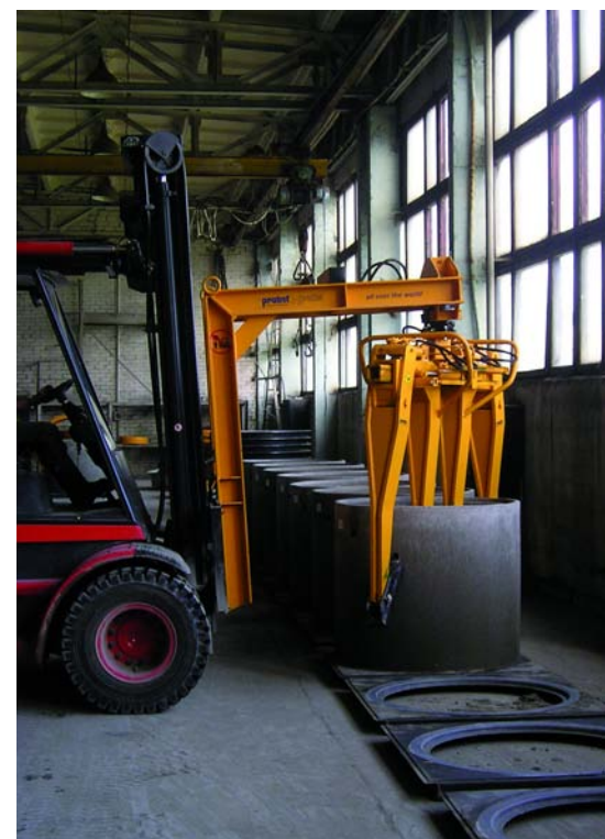
Транспортировка продуктов на открытый склад