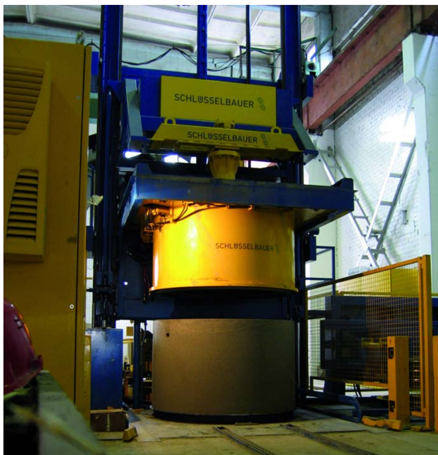
Для изготовления шахтных колец и конусов фирма Kauno Gelzbetonis приобрела новую производственную линию фирмы Schlüsselbauer

Magic 1501 реализована с высоким уровнем автоматизации, каждодневное обслуживание осуществляется двумя сотрудниками. Необходимые ступеньки, которые встраиваются в процессе виброуплотнения, а также арматурные кольца укладываются машинистом вручную.