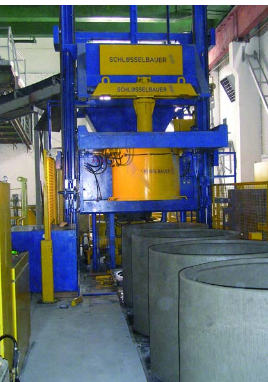
Свежие продукты в зоне «парковки», перед транспортировкой в зону набора прочности

другой тип продукта. Ассортимент выпускаемой продукции простирается до максимального внешнего диаметра 2 700 мм и веса 3 000 кг: от простых колец с отверстиями, заформованными для последующей вставки ступеней, до крупноформатных конусов с центрическим или эксцентрическим входом. Широкие или узкие ступеньки могут интегрироваться в изделия непосредственно в процессе виброуплотнения. Транспортировка продуктов к месту набора прочности и последующее манипулирование осуществляются либо посредством полно-