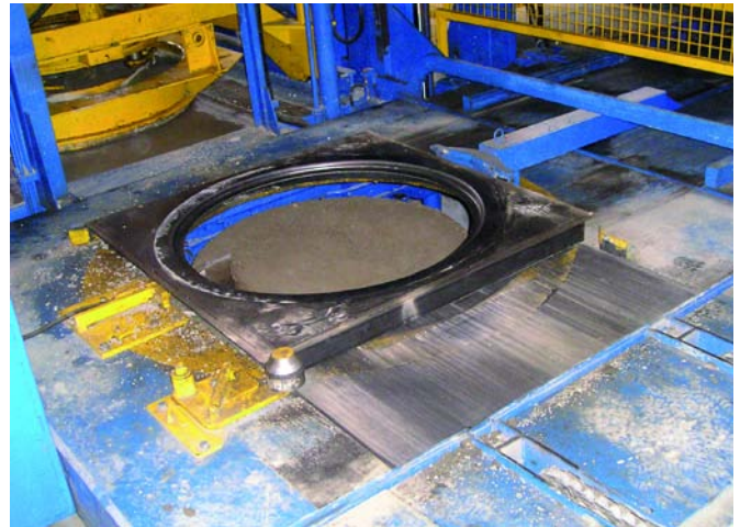
Производственный процесс: автоматически подается поддон, бетон заполняет форму, после уплотнения происходит непосредственная распалубка шахтного конуса и он выталкивается из установки

Время рабочего такта: в зависимости от изготавливаемого продукта Magic 1501 может осуществлять до 45 тактов в час. При выпуске элементов больших диаметров, до 1500 мм, среднее количество тактов в час равно 30.