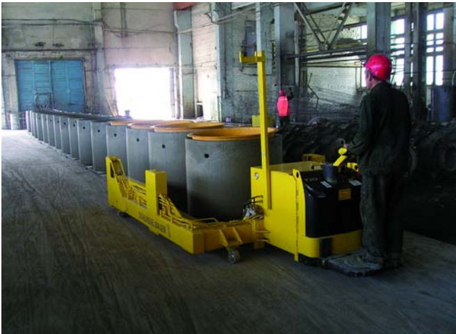
Magic 1501 на фирме Kauno Gelzbetonis рассчитана на обслуживание только двумя сотрудниками.