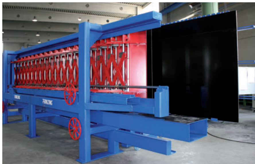
Sistema de encofrado ajustable para escaleras rectas prefabricadas de hormigón