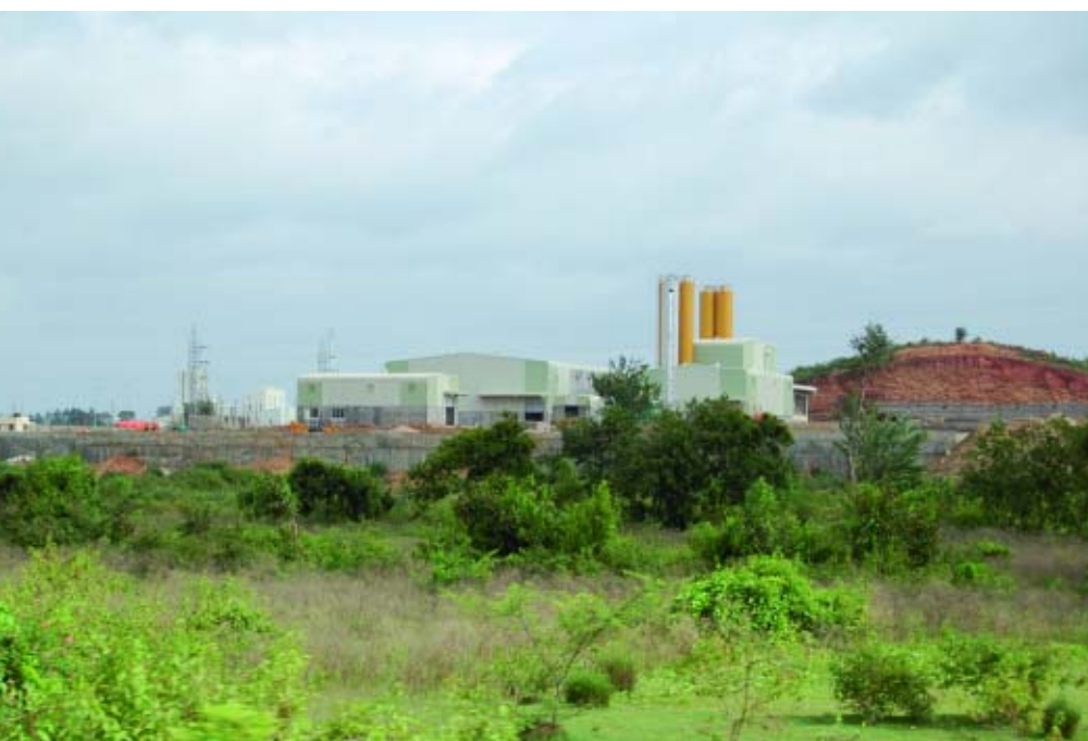
Стройплощадка для Basant Betons