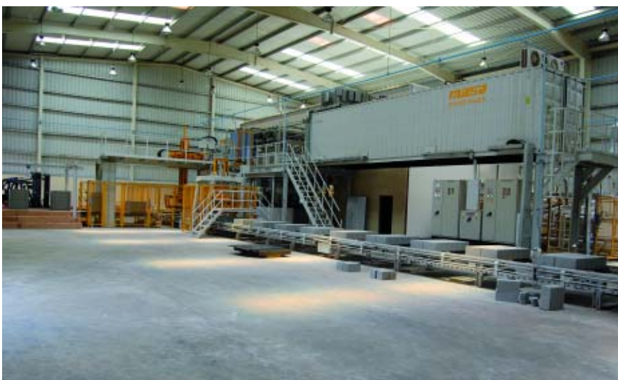
Все секции электрического контроля для всего завода помещены в единый шкаф