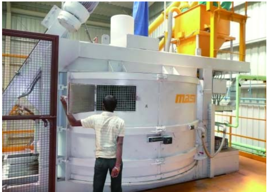
Два бетонных смесителя Masa для производства блоков

Теперь Суреш Патил поставил перед собой цель на практике применить свои обширные познания и высокие стандарты, построив завод, который сможет производить более 2000 м 2 брусчатки за 8-часовую смену. Таким образом, была придумана производственная линия, включающая бетонные изделия премиум-класса, такие как: очищенную шпунто-