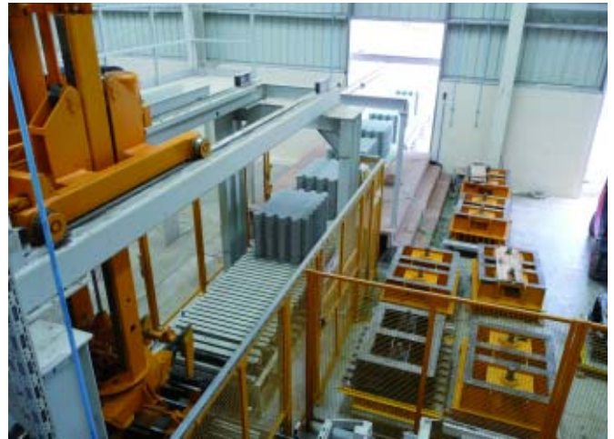
После окончания строительства завода в апреле 2008 года компания Basant Betons поставляют на рынок Индии продукцию непревзойденного качества

ходимая территория была выровнена, и даже некоторые холмы были удалены. Ров был засыпан, а на его месте была сооружена ограждающая стена, которая в некоторых местах достигает высоты восьми метров. Следующей постройкой стал лагерь для рабочих – во избежание миграции рабочих и целей скорого завершения строительных работ - типичный для индийских стройплощадок.