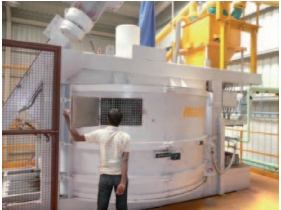
Zwei Betonmischer von Masa produzieren den Vorsatz- und Kernbeton für die Steinfertigung.

Seine umfangreichen Kenntnisse und hohen Ansprüche sollten nun in einer Anlage verwirklicht werden, die über 2000 m 2 Pflastersteine pro 8-Stunden-Schicht produzieren kann. Dabei war ein Produktprofil ange-dacht, das weit über das gewöhnliche Maß hinausgeht und vor allem Premium-Beton-erzeugnisse wie veredelte Verbundpflastersteine, Rasengittersteine, alle weiteren Produkte für Garten- und Landschaftsbau sowie Ziersteine aus Waschbeton umfassen sollte. Als eine der obersten Maxime gilt für