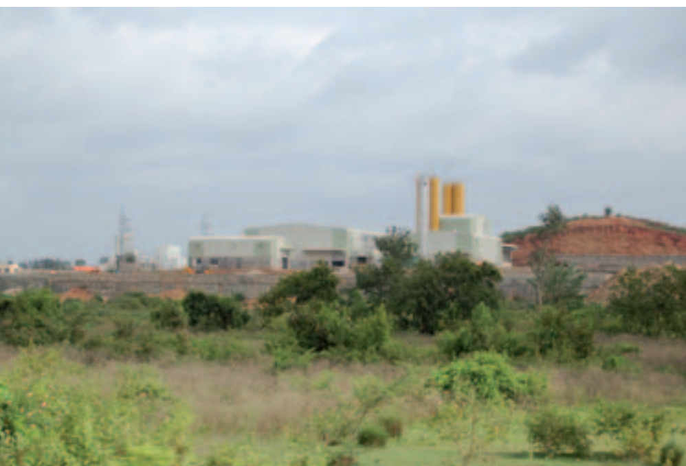
Bauland für Basant Betons

den Inder das Streben nach Produkten mit hohem ästhetische Wert, welche sich auf dem Markt deutlich von der Masse absetzen.