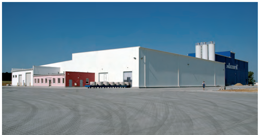
Новый завод фирмы ZPB Kaczmarek в Prusice – на переднем плане конвейер подачи на склад системы изготовления Perfect

Наряду с системой изготовления Perfect, где осуществляется выпуск колец с днищем диаметром 1000 мм с толщиной стенки 150 мм и диаметром 1200 мм с толщиной стенки до 230 мм, фирма ZPB Kaczmarek также при производ-