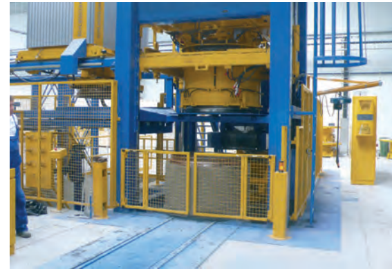
В эксплуатации Exact 1500 – полностью автоматизированная технологическая линия для выпуска шахтных элементов с поддонами и верхними муфтами

стве других шахтных компонентов опирается на самое высокое качество. Предприятие ZPB Kaczmarek первым и единственным в Польше начало произ-