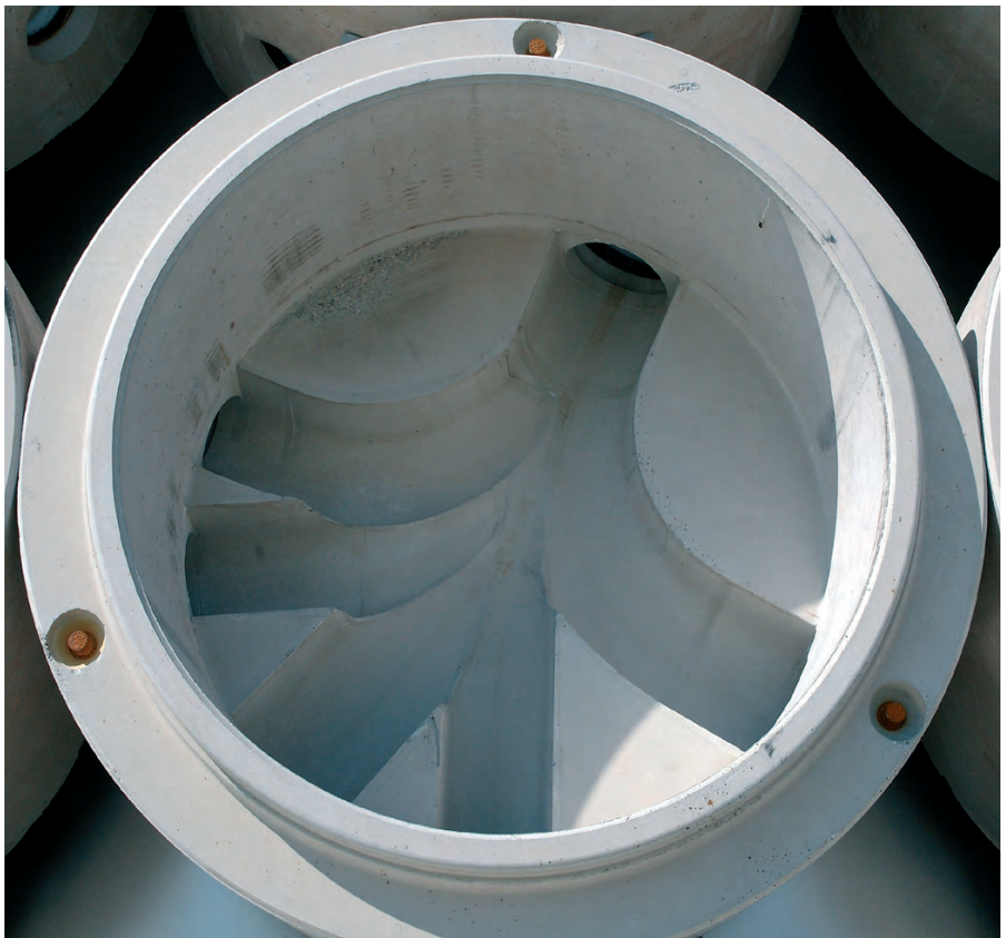
Монолитно и индивидуально – водоводы всегда точно соответствуют требованиям проекта