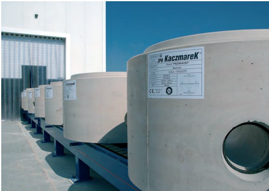
Маркировка каждого индивидуального кольца с дном способствует общей логистике – вплоть до установки на строительной площадке