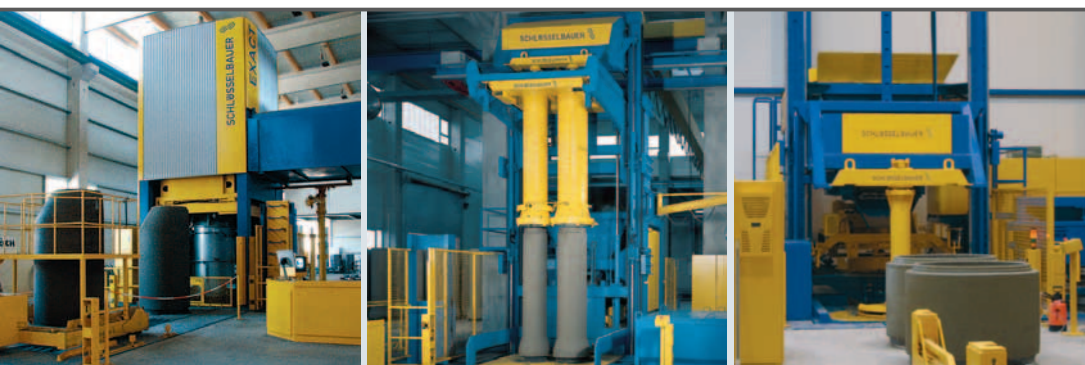
Installations de production pour tuyaux, éléments de regards et produits spéciaux

- sur les 40 que compte «Matériaux Pitois» - fabriquent chaque jour 20 à 25 fonds de regard, ce qui correspond à un doublement des capacités de production précédentes lorsque les cunettes étaient maçonnées manuellement... ▶