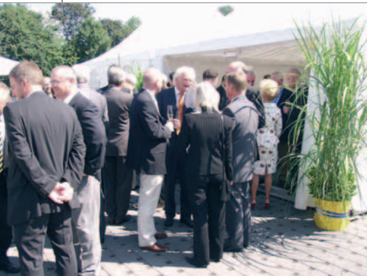
Conversazioni animate durante un intervallo tra un discorso e l'altro, accompagnate da uno splendido tempo estivo