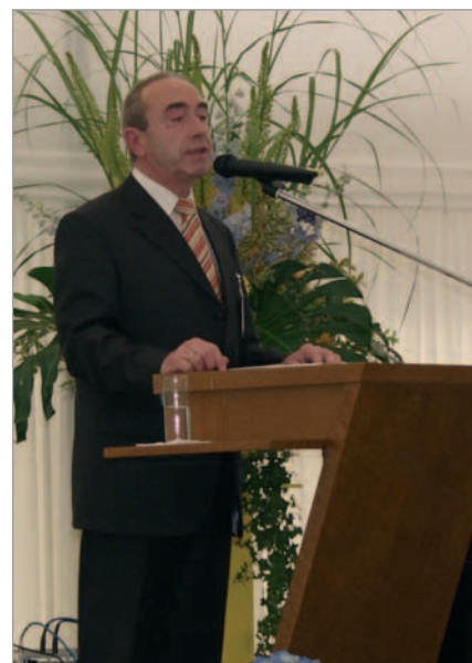
Il borgomastro di Andernach ha saputo apprezzare il rapporto esistente tra la città di Andernach e la MASA