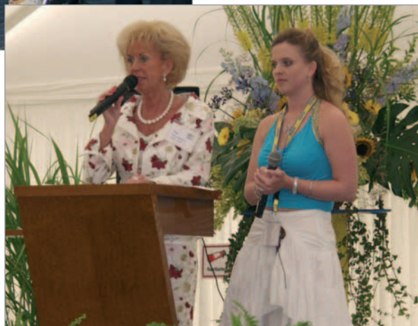
La proprietaria con la figlia durante il discorso di benvenuto