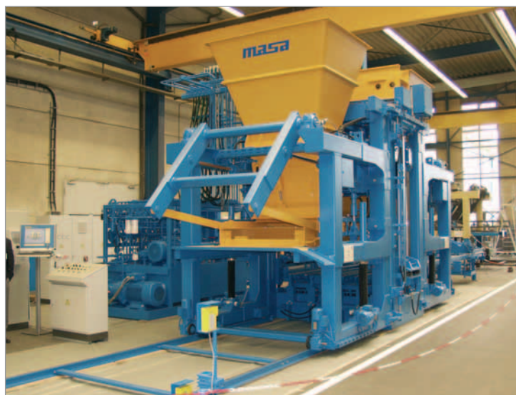
Uno sguardo nel capannone in cui ci sono le macchine pronte per essere spedite in tutto il mondo