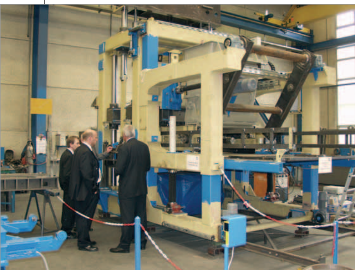
Les hangars de production où sont fabriquées les machines, avant d'être livrées dans le monde entier