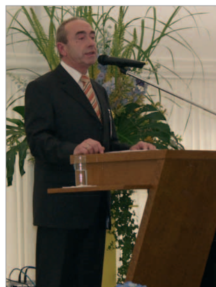
Le maire d'Andernach a salué l'excellente relation qu'entretient la ville avec Masa AG