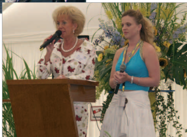
La propriétaire avec sa fille lors de son discours de bienvenue