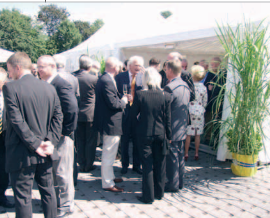
Conversations animées sous un soleil rayonnant entre deux discours