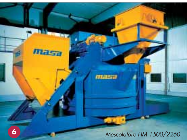
Masciolatore HM 1500/2250