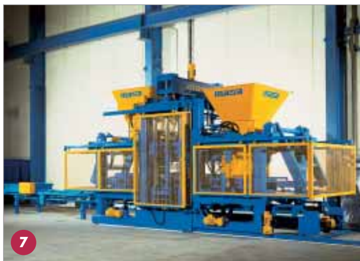
Record 9001 XL

Il gruppo Masa acquisisce competenza anche nel settore del calcestruzzo cellulare e dell'arenaria.